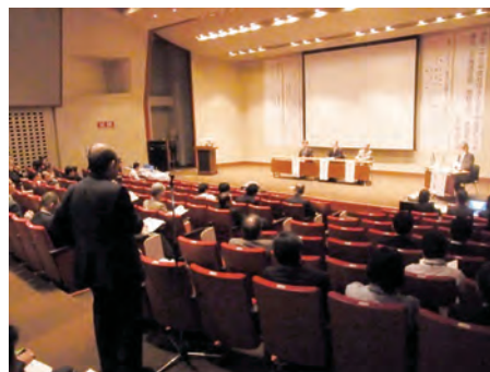
好評の臨床シンポジウム

はじめとする関係各位への謝辞が述べられました。臨床シンポジウムでは「保存が困難な歯に対する補綴的対応」、メインシンポジウムでは「これからの歯科を担う