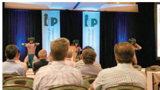
大会初日オープニングセレモニーにて

親交を深めました。今回のICPではOpening Ceremonyを含め、ソーシャルイベントに参加してハワイの伝統文化に触れることができたと思います。