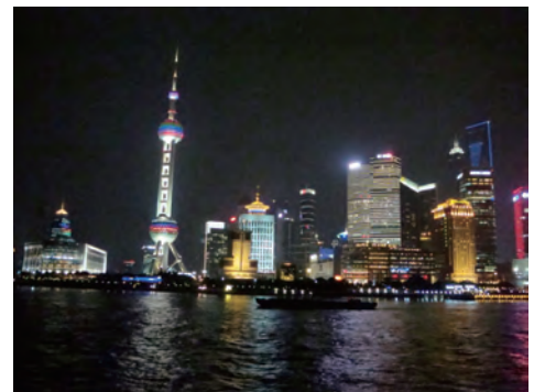
ディナークルーズ船上からの上海の夜景