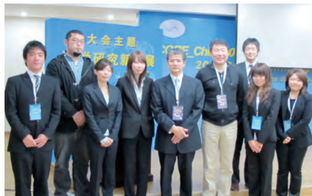
日本から参加された先生方