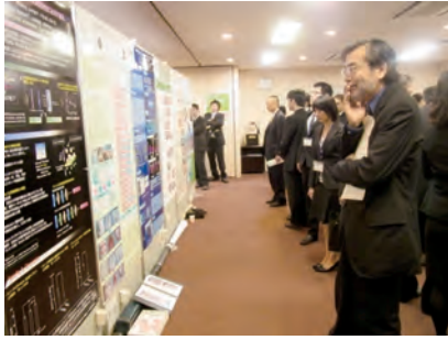
大盛況のポスター会場