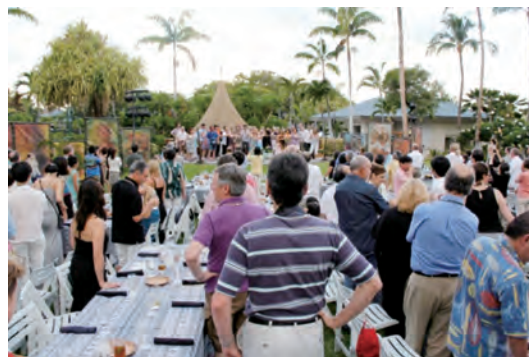
Hawaiian Luau 参加者、Hawaiian Dance の練習、Social Outing にて

ソーシャルイベントとして、Welcome Sunset Receptionでは太平洋の見えるプールサイドで素晴らしい日の入りを眺めながら各国の参加者同士で再会を祝い、Social OutingではHawaiian Luau(ハワイの宴)があり、The Fairmont Orchidでポリネシアンダンス、ハワイアンダンスを楽しみながらのパーティーで大いに