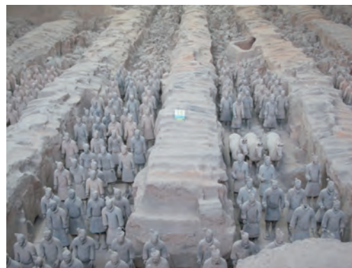
秦始皇兵馬俑博物館