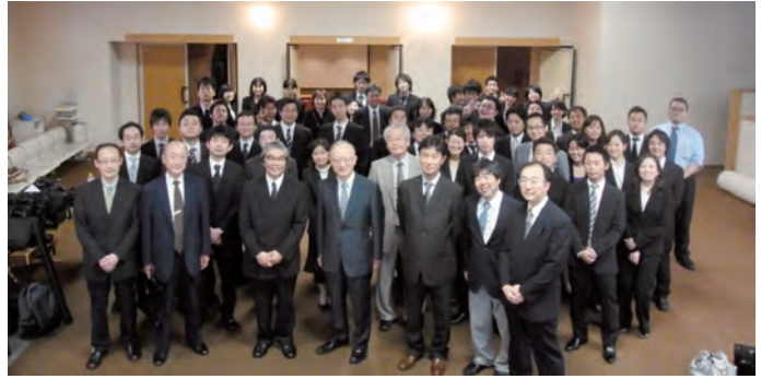
自慢の3校合同実行委員会

補綴の新テクノロジー」というテーマで活発な討議がなされ、一般口演、ポスター発表、専門医申請ケースプレゼンテーション、生涯学習公開セミナーでも活発な質疑応答が行われました。別会場での市民フォーラムも70名を超える参加者があり、市民から多くの質問も出されて地域社会との交流がはかられました。さらに懇親会に